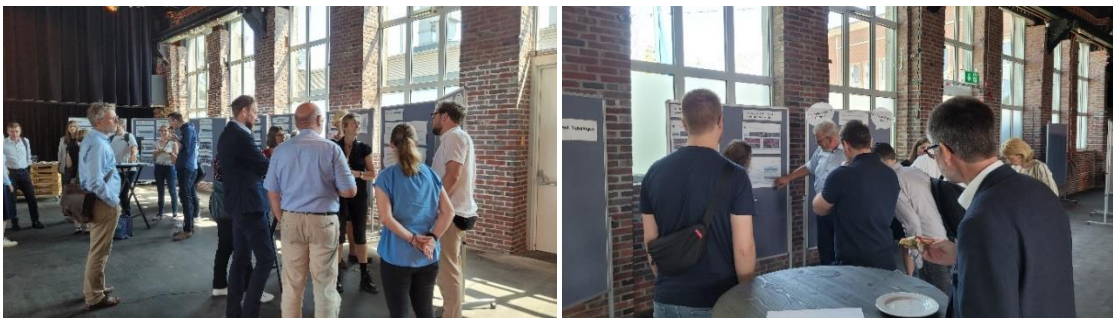
Abbildung 4: Austausch und Gespräche mit den Fachexperten und Fachexpertinnen