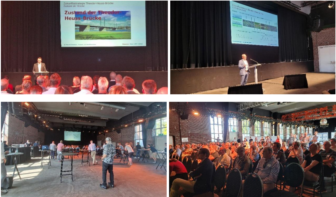
Abbildung 3: Grußworte und Vorträge auf der Infomesse